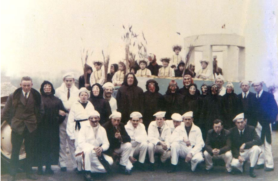
De wagen en groep van de verbroedering tussen reuzen en heksen tijdens de carnavalstoet te Nieuwpoort (Heksenstoet).