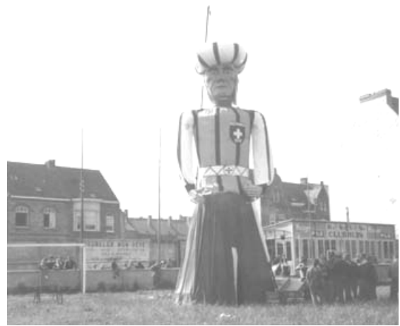
JAN TURPIN II voor de eerste maal gemonteerd. Dit gebeurde op het voetbalplein van K.S.V.Nieuwpoort in de Onze Lieve Vrouwestraat in de lente 1963. Enkele weken voordien was de eerste poging mislukt. Tijdens de montage was een buis gebroken.