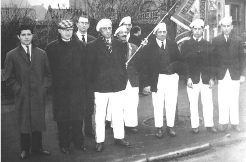
Groepsfoto genomen in de Willem De Rooiaan juist naast de ingang tot de koer van het St.-Bernardus College