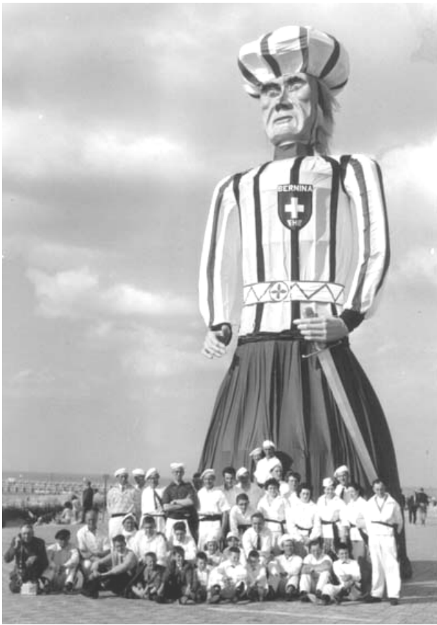
JAN TURPIN II te Nieuwpoort-Bad op 14 juli 1963.