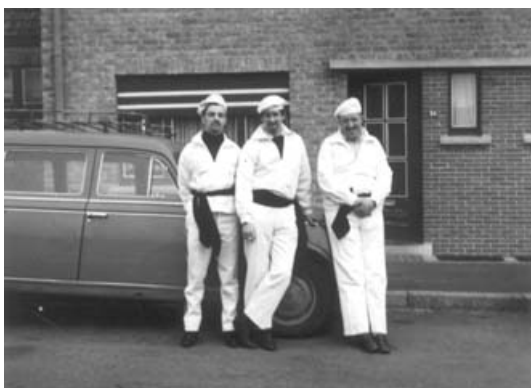
Nog vlug even poseren voor de lens van de camera, voor het vertrek naar het lokaal voor de uitstap met de reuzen.