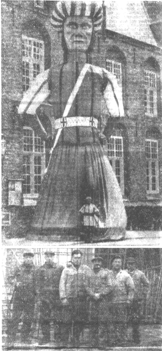
Boven: Jan Turpijn zoals hij er zal uitzien. — Onder: de mannen, leden van de gilde, die aan de Nieuwpoortse reus werken.

Enkele maanden geleden hebben wij melding gemaakt van de heropstanding van de grote Jan Turpijn, Nieuwpoorts roemrijke vooroorlogse reus, die steeds een der allergrootste reuzen van het land is geweest.