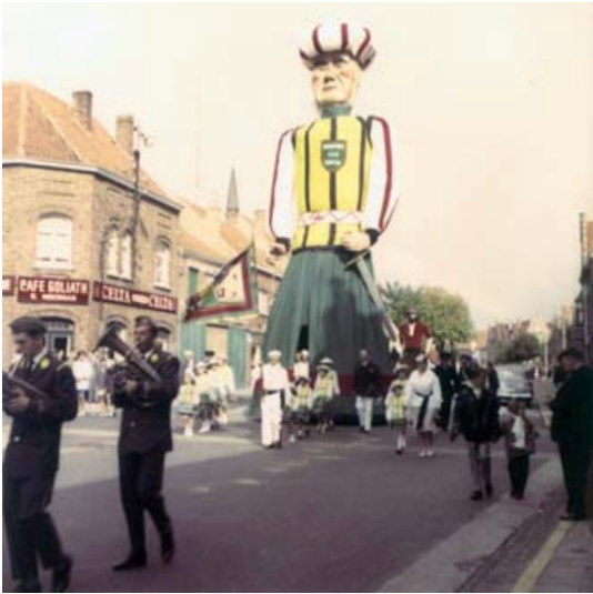
Hoek Duinkerkestraat, Willem De Roolaan en Canadalaan.