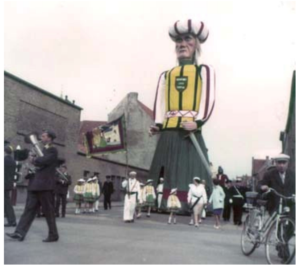
Hoek van de Astridlaan en Canadalaan.